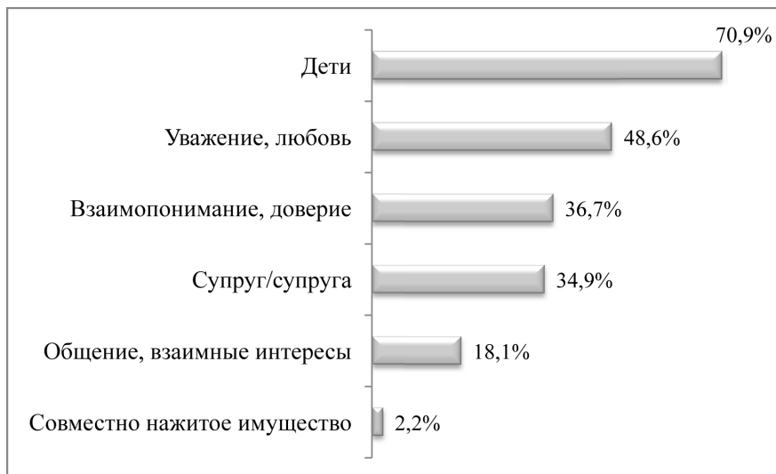
Рисунок 3 – Распределение ответов респондентов на вопрос «Как Вы думаете, что является самым ценным/основным в семейной жизни?»

опроса (71%), самым основным, самым ценным в семейной жизни являются дети. Результаты представлены на рисунке 3. Здесь следует отметить, что подобное распределение ответов характерно для всех изучаемых групп респондентов.