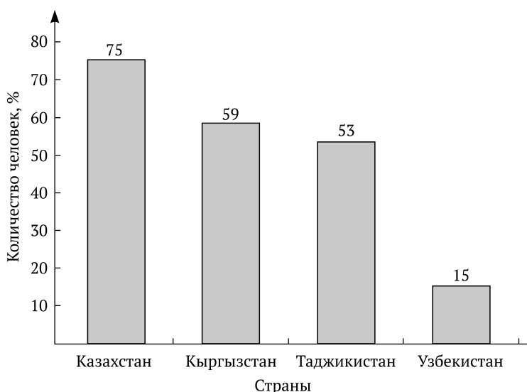
Рис. 2. Доля интернет-пользователей в исследуемых странах, по данным последнего опроса