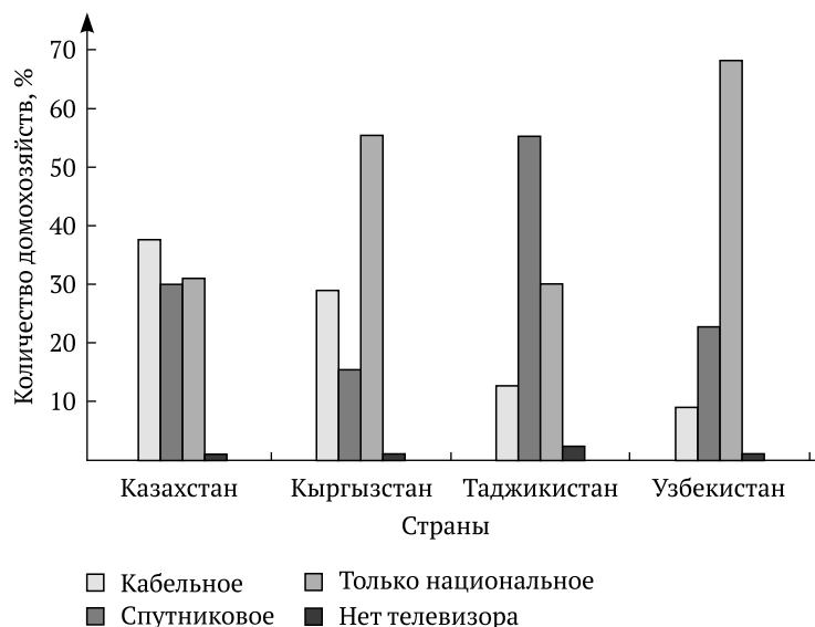
Рис. 1. Виды телевидения в домах жителей исследуемых стран, по данным последних двух опросов