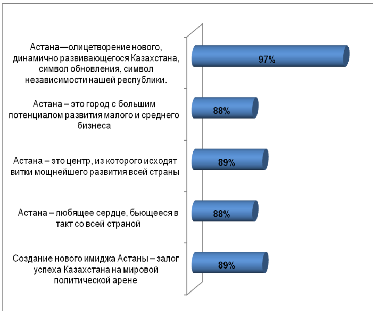
Рисунок 3. Восприятие имиджа Астаны глазами жителей города, N=500.

Согласно полученным результатам опроса, можно увидеть, что в настоящий момент жители Астаны в целом единодушны в своем согласии с данными высказываниями. Практически все согласны с тем, что Астана – это олицетворение нового Казахстана, символ страны. Особенно положительно смотрят на роль Астаны и ее образ жители города, проживающие там 5-10 лет.