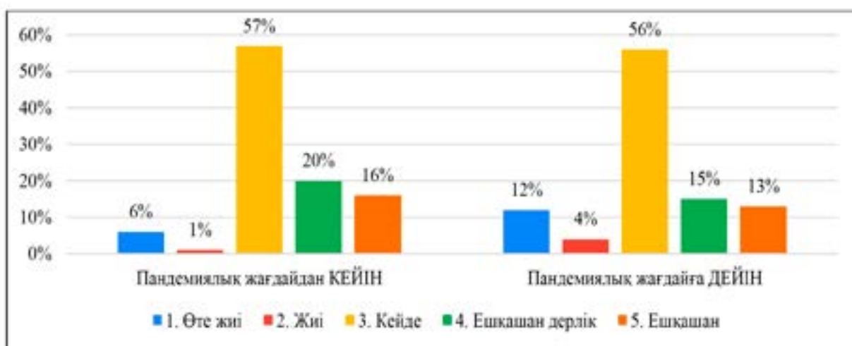
3-сурет – Респонденттердің олардың өмірлерінде қиын жағдай немесе шешілмейтін мәселелерді туындататын сезімдер болған кезде, оларды шешуге қауқарларының өзіндік бағалауларының нәтижесі

Екінші және үшінші суреттің нәтижелері көрсетіп отырғандай пандемияға дейінгі кезеңде әйел-оқытушыларда психологиялық күйзеліске ұшыратқан мәселелер көбейген. Респонденттер дегенімен өз өмірлеріндегі маңызды мәселелерді бақылай алу дәрменсіздігі мен қиындықтар орын алған кезде, оларды шеше алмау қауқарының болғанын «кейде» деген жиілікте жоғары бағалаған.