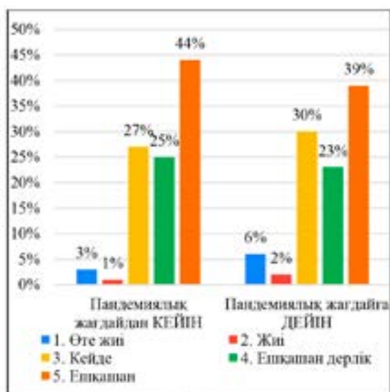
6-сурет – Әйел-оқытушылардың өздерін жалғыз сезіну күйлерін қаншалықты жиі сезінетіндіктерін бағалауларының нәтижесі

оларға өздерінің кейбір жағдайлардың орын алуына байланысты нервозды, шиеленісті күйді жиі сезінулерін анықтаған болатынбыз. Нәтижесінде, пандемияға дейін «кейбір кезде» деп жауап бергендер 50%, ал пандемиядан кейін 54%-ды көрсеткен. Нервоздық күйді «өте жиі» сезінемін дейтіндер пандемиядан кейінгі кезеңде 8%, ал пандемиядан кейін бұл 17% көрсеткен.