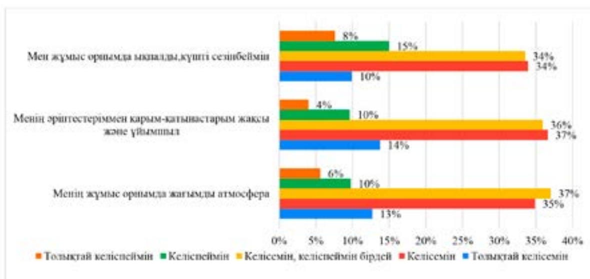
8-сурет – Зерттеуге қатысушы әйел-оқытушылардың психологиялық күйіне әсер етушілер ретінде олардың жұмыс орындары, басшылықтары, әріптестері тарапынан болатын қысымды бағалауларының нәтижелері

Зерттеудің нәтижесінде респонденттердің тек 10%-ы ғана жұмыс орнында ықпал мен күштерді сезінетіндіктерін атаған, 8% бұл тұжырыммен келісетіндіктерін атаған. Әйел-оқытушылардың 14% әріптестерімен қарым-қатынастарының ұйымшыл емес, нашар екендігін атаған. Ал бұл тұжырыммен келісетін, бірақ кейбір тұстарымен келіспейтін респонденттер 36% көрсеткен. Респонденттердің 37%-ы жұмыс орындарындағы атмосфераның жақсы екендігін бағалау кезінде тұжырыммен толықтай келіспейтіндіктерін атаған. Ал 10% респондент бұл тұжырыммен келіспейтіндіктерін атап, жұмыс орнындағы атмосфераны кері тұсында бағалаған.