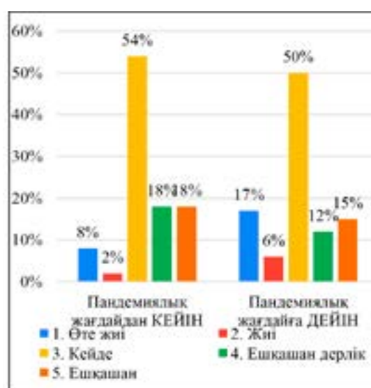
5-сурет – Әйел-оқытушылардың әртүрлі жағдайлардың орын алуына байланысты өздерін шиеленіс, нервозды күйіндегі жағдайларын бағалауларының нәтижесі