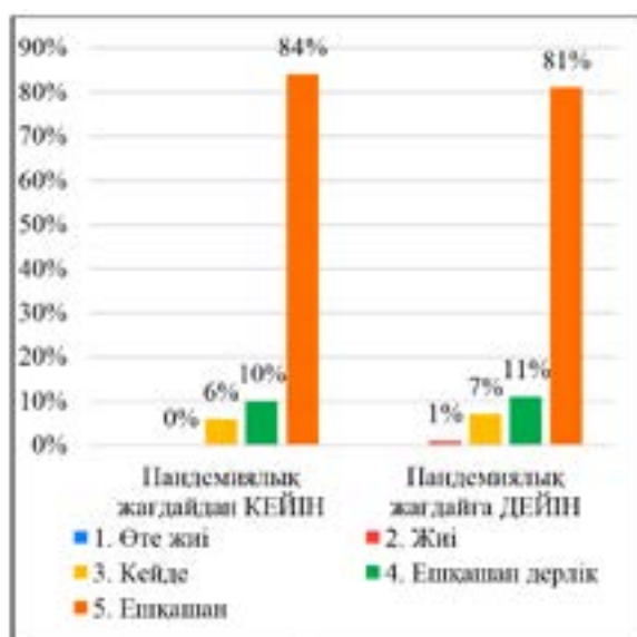
7-сурет – Әйел-оқытушылардың өз-өзіне қол салу ойларының қаншалықты жиі сезінетіндіктерін бағалауларының нәтижесі

6 сұрақтың нәтижесі көрсетіп отырғандай пандемиялық жағдайдан кейін әйел-оқытушылардың 44% ешқашан жалғыздық сезімдерін сезінбегендіктерін атаған, ал пандемиялық жағдайға дейін ол жауап 39% көрсеткен. Өте жиі деп жауап бергендер саны 3% пандемиядан кейін болса, бұл пандемияға дейін 6% көрсеткен. Көрсеткіштер әйел-оқытушылардың қашықтықтан жұмыс істеу кезінде жалғыздық сезімдерін аз сезінгендіктерін көрсетіп тұр, бұны зерттеушілер тобы қашықтықтан жұмыс істеу кезінде, пандемия кезінде отбасы мүше-