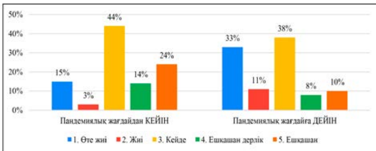
2-сурет – Әйел-оқытушылардың өз өмірлерінде орын алған маңызды жағдайлар мен құбылыстарды басқара алу мүмкіндіктерін бағалауларының нәтижесі

Пандемия кезіндегі әйел-оқытушылардың психологиялық күйлерін зерттеу пандемияға дейінгі және пандемия кейінгі деп екіге бөлініп сұралған. Зерттеушілер тобы әйел-оқытушылардың өздерінің психологиялық күйлерін бағалауларын сұрастырып, олардың жалпы пандемия кезіндегі психологиялық күйлерін анықтап, әйел-оқытушыларға қандай тақырыптар мен мәселелер шеңберінде психологиялық көмектер қажет екені анықталды. Екінші суретте біз респонденттердің өздерінің өмірлерінде болып жатқан жағдайларды бақылауда ұстау мен басқаруларын бағалауларын анықтаған болатынбыз, нәтижесі төменде көрсетілген.